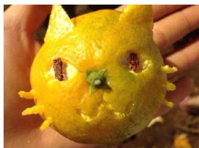
（イメージ）ピールアート