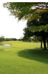
早朝訓練では、ゴルフ場を特別利用