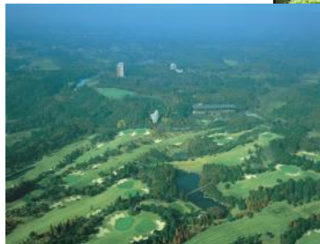
大自然がフィールド

首都圏から1時間という恵まれたアクセス、夏涼しく冬温暖な房総の台地にひろがる「生命の森リゾート」は、総面積330万平方メートルという広大な敷地内に、豊かな森に囲まれて500名を収容する宿泊施設です。