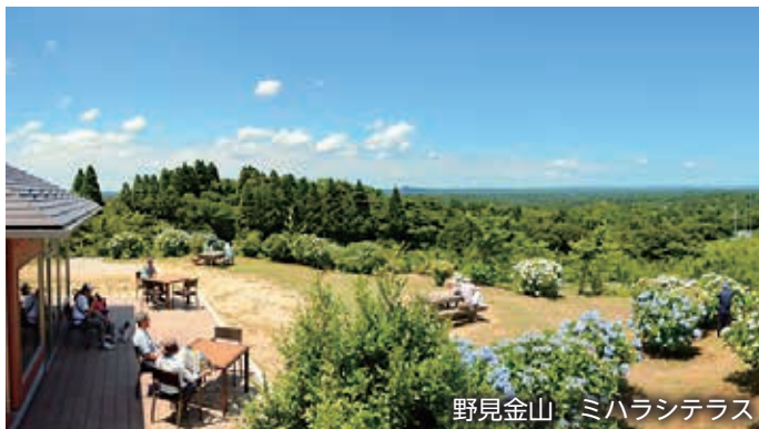
野見金山 ミハラシテラス