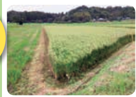
ご参加者にはもれなく 長南町の新米を進呈!

アクアラインと圏央道の開通で都心から1時間ほどの距離になった長南町。都心にはない自然と懐かしい街並みが残る町。この2つの相反する魅力を見学にいきましょう。心地よい風、青い空、咲き誇る花々が企業にとっての発展のステージを彩ります。