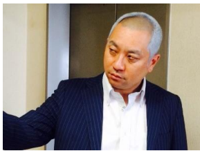
【ある添(レーザーラモンRG)】

申込受付期間 2016年7月11日(月)10:00 ~ 2016年7月15日(金)17:00まで