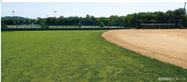
観測場所(イメージ)

■観測場所：アメリカ テネシー州ナッシュビル近郊(ギャラティン) Triple Creek Park(第9・11野球場) 西経/086°25'37"W 北緯/36°24'49"N 標高/180m