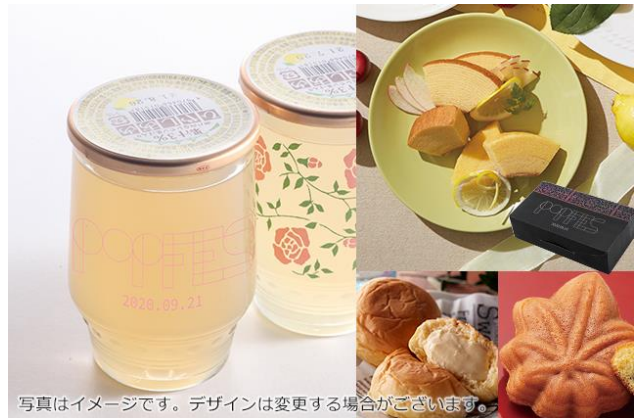
写真はイメージです。デザインは変更する場合がございます。

④「冷やしあめ」 （“P.O.P”Festival ロゴ入り瓶仕様)と 広島スイーツセット (¥6,800)