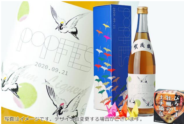
写真はイメージです。デザインは変更する場合がございます。

①「純米酒仕込 梅酒 720ml」 （“P.O.P”Festival ロゴ入りラベル&オリジナル パッケージ）と広島おつまみセット(¥3,500)