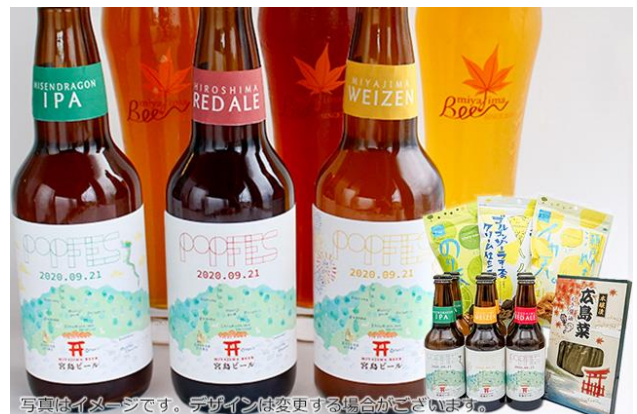
写真はイメージです。デザインは変更する場合がございます。

⑤「宮島瓶ビール6本セット」 （“P.O.P”Festival ロゴ入りラベル)と 広島おつまみセット(¥6,900)