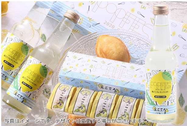
写真はイメージです。デザインは変更する場合がございます。

③「島ごころ」レモンサイダー(“P.O.P”Festival ロゴ入りラベル)とレモンケーキ （“P.O.P”Festival ロゴ入りパッケージ)セット （¥4,800)