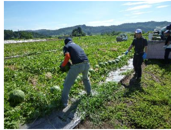
すいか収穫作業イメージ