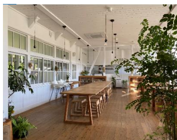
↑ノルディスクビレッジゴトウ レストラン