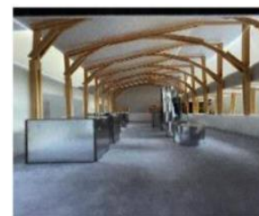
↑五島つばき蒸溜所