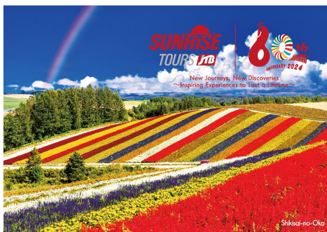
四季彩の丘(北海道美瑛町) ※イメージ