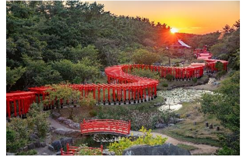
高山稲荷神社 ※イメージ

本ルートは、東北最大の都市である仙台を旅の起点とし、平泉、盛岡、角館、青森、弘前と北上しながら巡るルートです。東北エリアは各地に魅力的なコンテンツがあるものの、二次交通の課題により、外国人観光客にとっては周ることが難しいエリアとなっていました。本ルートではそれぞれの魅力を行程に組み込むことで、その課題を解決し、新たな人流を創出します。