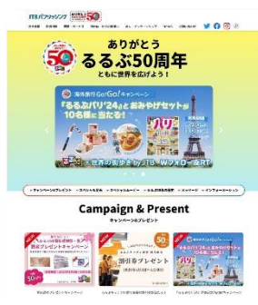
「るるぶ 50 周年キャンペーン」サイト