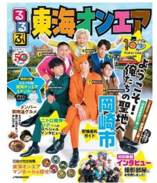
『るるぶ東海オンエア』表紙