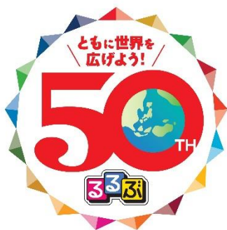
「るるぶ 50 周年キャンペーン」ロゴ

株式会社 JTB と JTB グループで旅行・ライフスタイル情報を提供する株式会社 JTB パブリッシングは、1973 年 6 月 20 日に月刊誌『旅』の別冊として誕生した「るるぶ」の創刊 50 周年を記念し、これまでご愛顧いただいた読者、ユーザーの方々へ感謝の気持ちをこめて「るるぶ 50 周年キャンペーン～ともに世界を広げよう！」を 2023 年 4 月より 1 年間実施します。