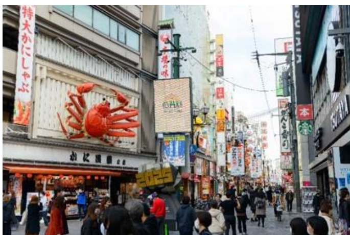
<道頓堀商店街>

( https://dotonbori-night.com/news/2023/clean/ )