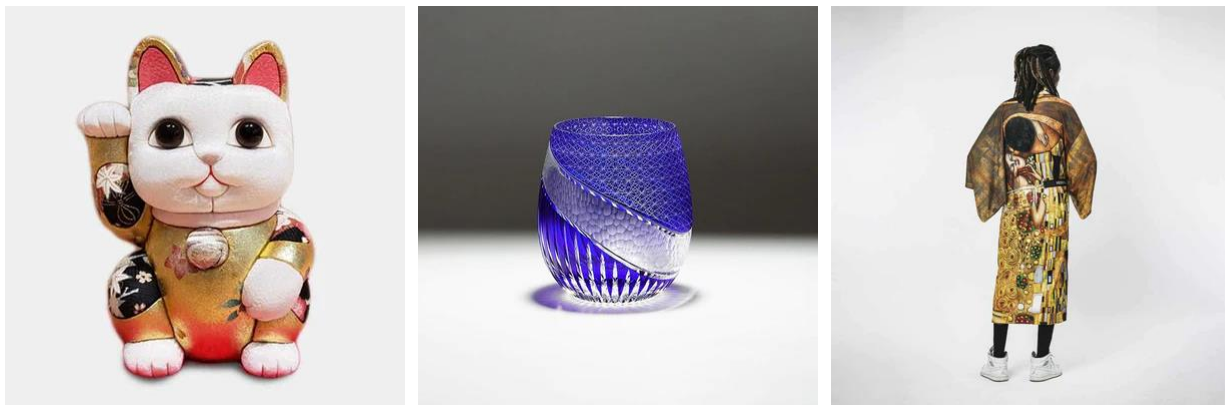
商品の一例 左:招き猫(柿沼人形) 中央:切子(凧然) 右:着物ブランド(VEDUTA)

「ARTISAN」では、KAZAANA が提供する越境 EC プラットフォームサービスを利用し、34 ブランド、約 1,200 の伝統工芸品を米国内向けに販売いたします。「柿沼人形」の招き猫やだるま、「凧然」の切子、「VEDUTA」の着物など、厳選した商品をラインナップ。JTB USA が持つ米国での販売基盤、法人サービスのネットワークやマーケティングのノウハウを活かし、日本文化のファンや高品質な伝統工芸を求めるお客様に魅力ある商品をお届けしてまいります。さらに、法人向けの贈答品やイベントの商品として活用できるよう、企業名やロゴを入れるサービスも提供いたします。