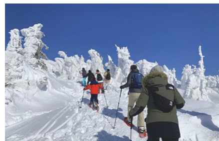
スノーシューツアーの様子