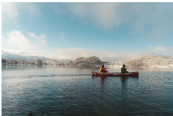
カヤック体験(イメージ)

「日本の旬 アドベンチャーツーリズム」公式ホームページ： https://www.jtb.co.jp/newtourism/