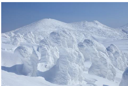
八甲田 樹氷群(イメージ)