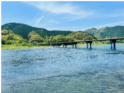
四万十川 佐田沈下橋