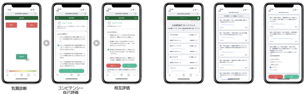
<③事後アンケート 受験画面(イメージ)>

(※)事後アンケートには、学校独自の質問も任意で追加することができます(最大 3 問)