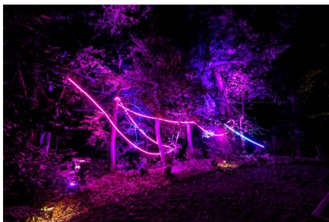
【恋柱・甘露寺蜜璃の照明演出のイメージ】

株式会社 JTB は、『テレビアニメ「鬼滅の刃」刀鍛冶の里編』の体験型イベントのメインコンテンツのひとつである音声 AR を使ったアトラクション「Locatone™(ロケトーン)鬼滅の刃 湯めぐりの旅」の照明演出の一部を「鬼滅の刃 湯めぐりの旅」公式サイトに公開しました。同イベントは 2023 年 11 月 11 日～2024 年 2 月 12 日まで湯河原温泉と渋川伊香保温泉で同時開催されます。