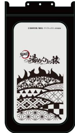
【湯めぐりの旅「スマホケース」】