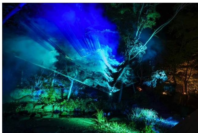
【霞柱・時透無一郎の照明演出のイメージ】