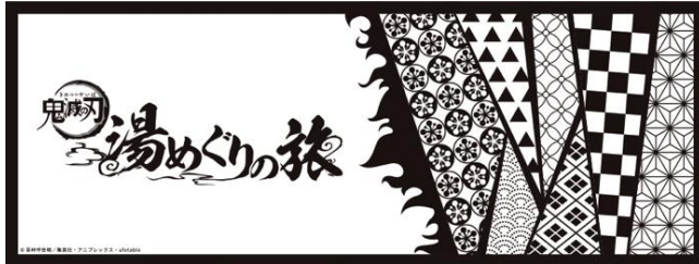
【湯めぐりの旅「手ぬぐい」】

ローチケ(ローソンチケット) https://l-tike.com/event/mevent/?mid=698120