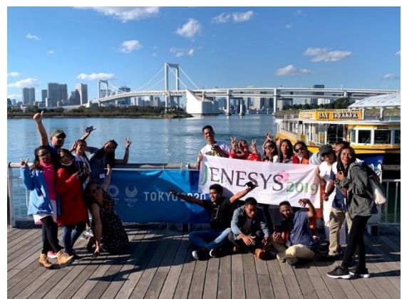
11月4日【テーマ関連視察】 オリンピック関連施設（お台場）