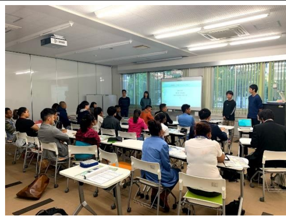
10月31日【テーマ関連講義・交流】 岐阜大学 地域科学部