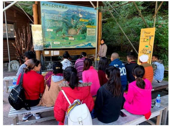
11月1日【テーマ関連視察・表敬】 下呂市エコツーリズム推進協議会 「下呂市エコツーリズムの取り組み」