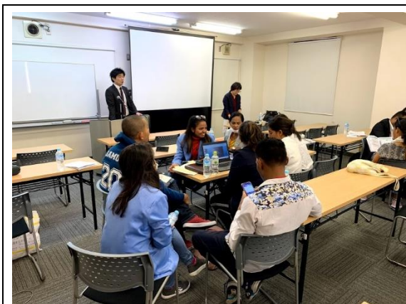
11月5日【ワークショップ】