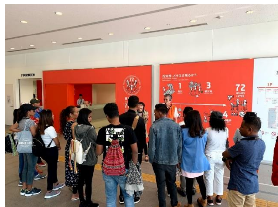
11月4日【テーマ関連視察】 東京臨海広域防災公園