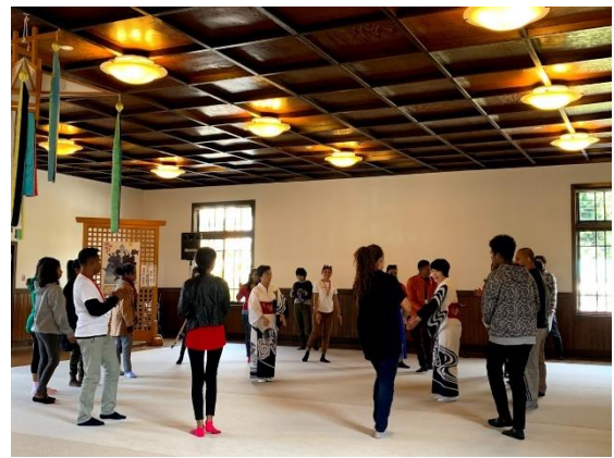
11月2日【テーマ関連視察】 郡上おどり保存会 郡上踊り体験