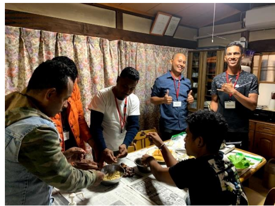
11月1日【ホームステイ】 岐阜県郡上市八幡町