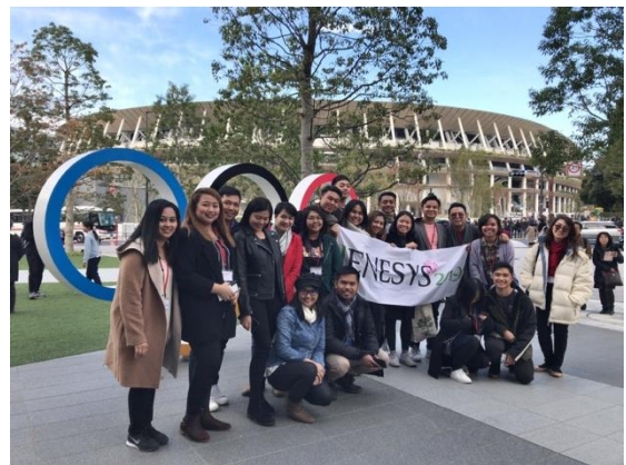
12月1日【オリパラ関連施設視察】 日本オリンピックミュージアム