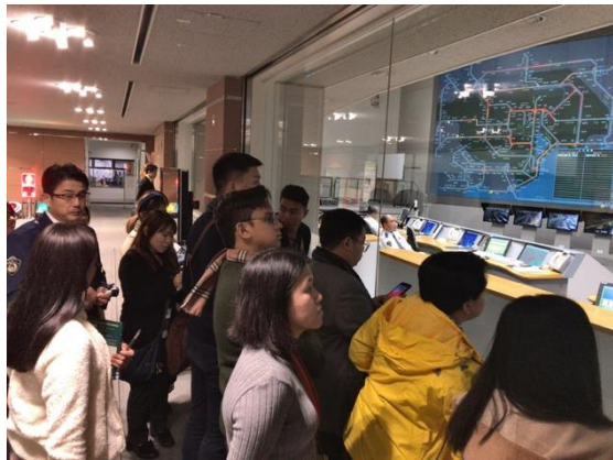
11月28日【インフラ/テーマ関連視察】 交通管制センター