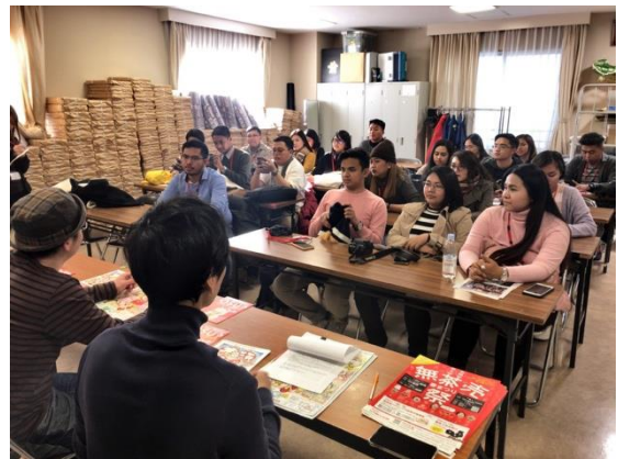
11月29日【日本文化視察】 大須商店街