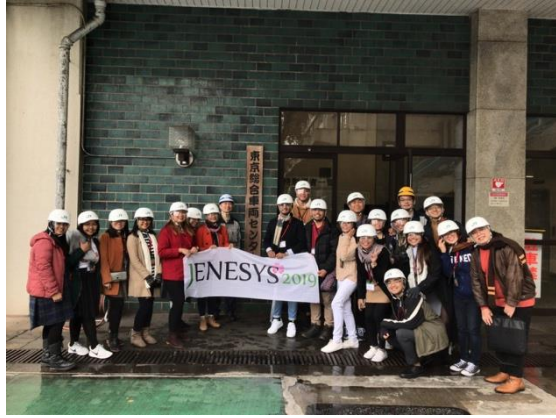
11月27日【インフラ/テーマ関連視察】 東日本旅客鉄道株式会社