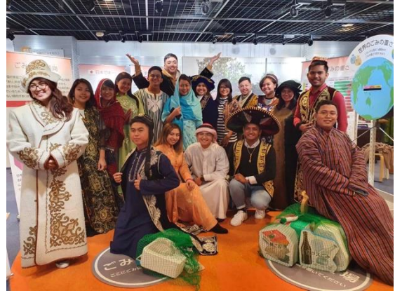
11月27日【インフラ/テーマ関連講義】 JICA