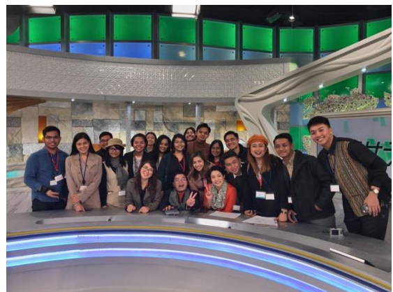
12月2日【メディア/テーマ関連視察】 株式会社テレビ東京ホールディングス