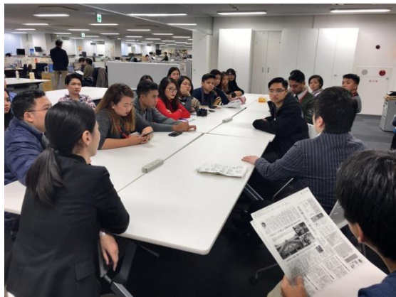
11月29日【メディア/テーマ関連視察】 朝日新聞社名古屋本社