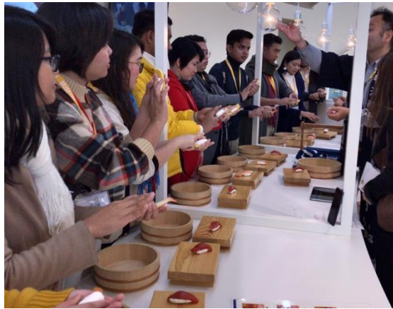
11月30日【日本文化視察】 MIZKAN MUSEUM(ミツカンミュージアム)