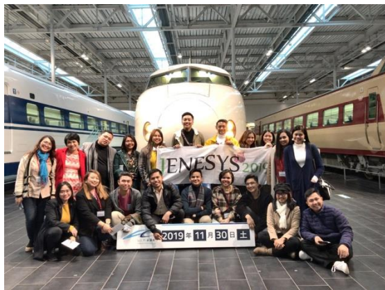
11月30日【インフラ/テーマ関連視察】 リニア・鉄道館