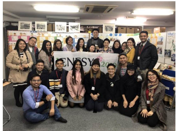
11月28日【インフラ/テーマ関連視察】 アイキャン