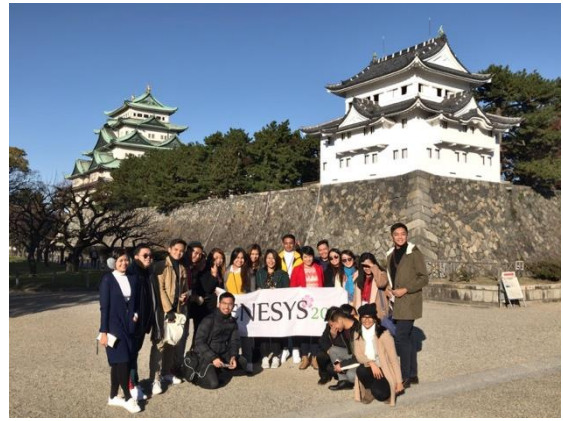
11月30日【日本文化視察】 名古屋城