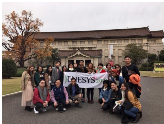
12月1日【メディア/テーマ関連視察】 東京国立博物館、TNM&TOPPAN ミュージア ムシアター