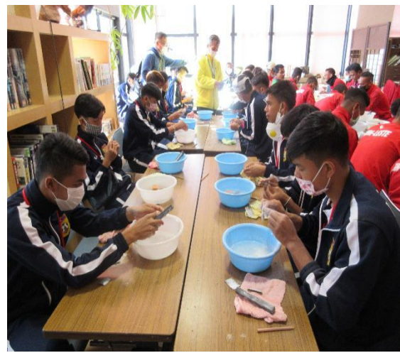
2月27日【日本文化体験】 指宿市考古博物館