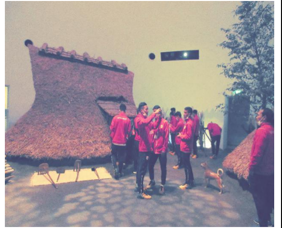
2月26日【日本文化体験】 指宿市考古博物館