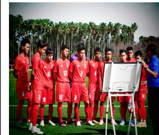
2月26日【スポーツ交流】 ミャンマー