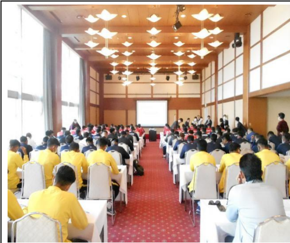
2月24日【オリエンテーション】