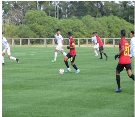
2月27日【スポーツ交流】 サッカー試合