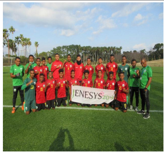
2月27日【スポーツ交流】 東ティモール