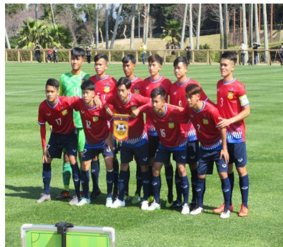
2月27日【スポーツ交流】 ラオス