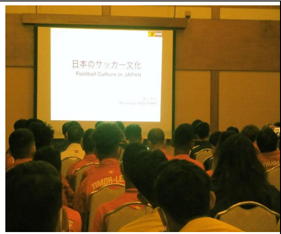
2月25日【講義】 公益財団法人日本サッカー協会