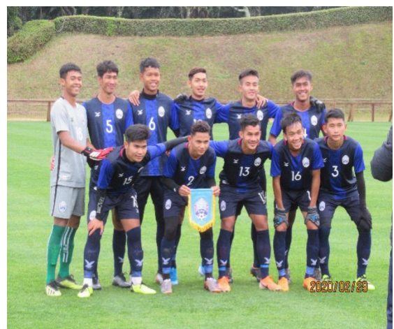
2月28日【スポーツ交流】 カンボジア