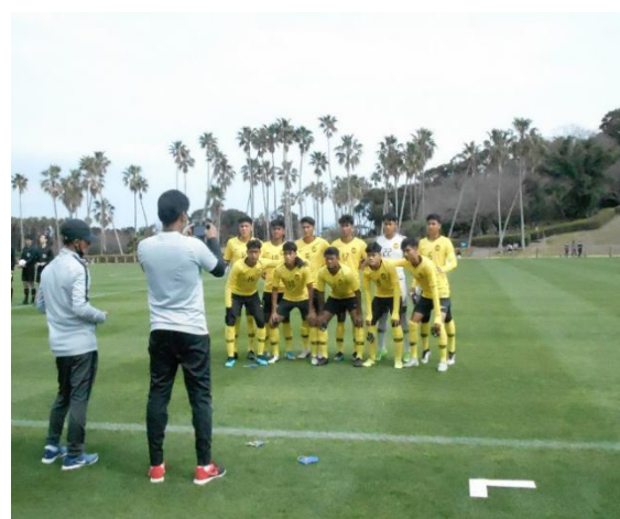
2月28日【スポーツ交流】 マレーシア