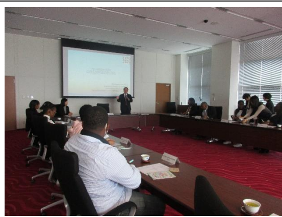
1月31日(金) 公益社団法人 2025年日本国際博覧会協会 ブリーフィング