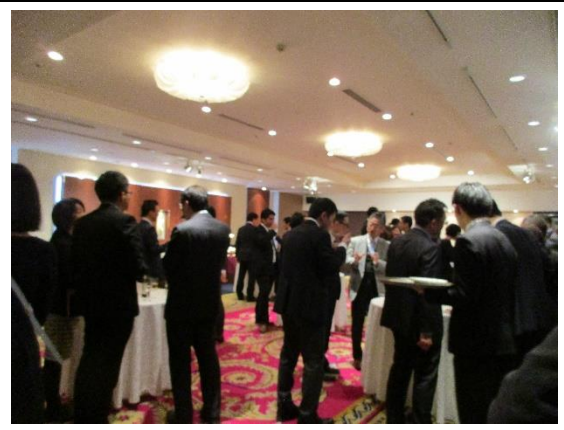
1月27日(月) 外務省中南米局長主催レセプション