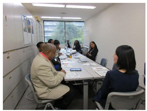
1月28日(火) 外務省ブリーフィング