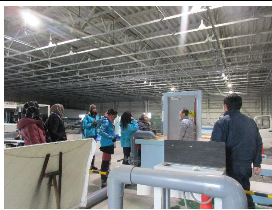
1月31日(金) 京都大学防災研究所視察