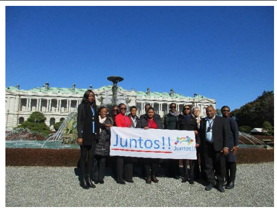
1月29日(水) 迎賓館赤坂離宮視察