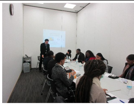
1月29日(水) JICA ブリーフィング