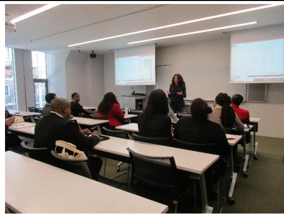
1月29日(水) 上智大学ブリーフィング