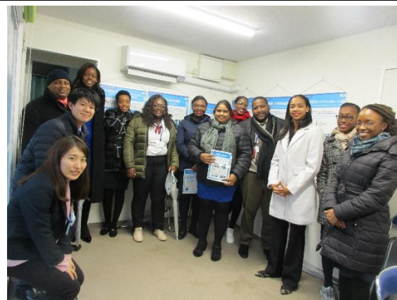
1月28日(火) 横浜市風力発電所(ハマウィング)視察