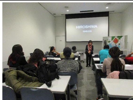
1月30日(木) 被爆者体験講話聴講