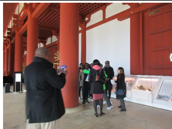
1月31日(金) 平城宮跡(大極殿)視察