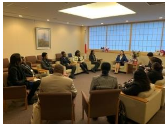
1月28日(火) 尾身朝子外務大臣政務官表敬