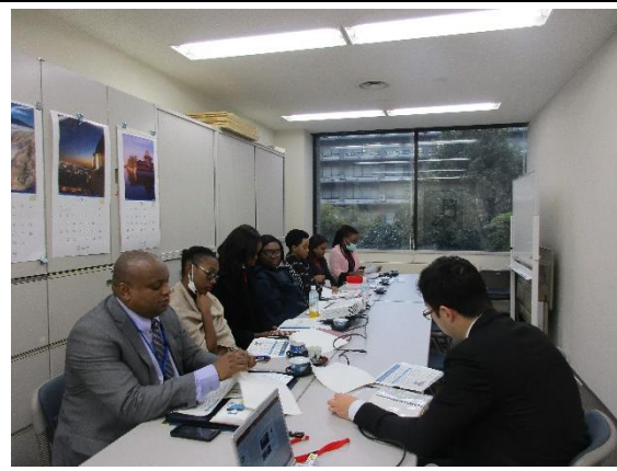
1月27日(月) 外務省ブリーフィング