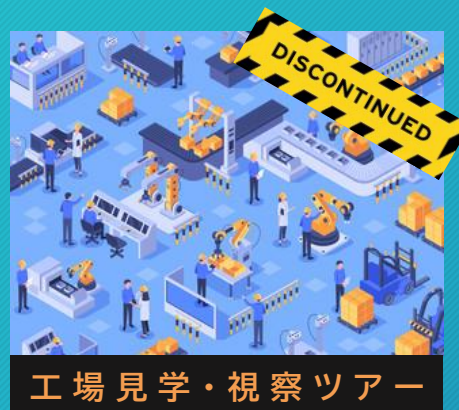
工場見学・視察ツアー