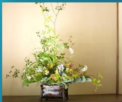
華道・書道・折り紙