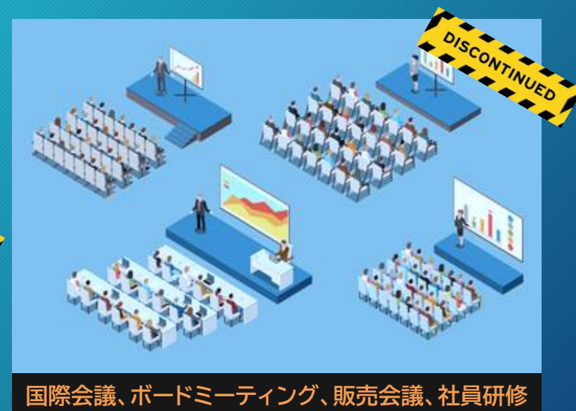
国際会議、ボードミーティング、販売会議、社員研修