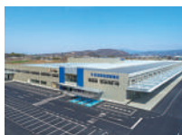
(株) 栗原医療器械店