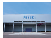
冬木工業(株) 高崎工場