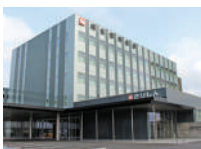
桐生信用金庫 太田スクエア