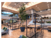
(株) 日東システムテクノロジーズ