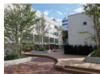
しのめ信用金庫 前橋営業部