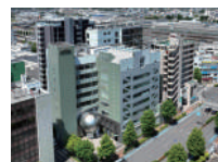
(株) 上毛新聞社 本社