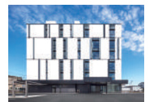
(株) ジーシーシー本社