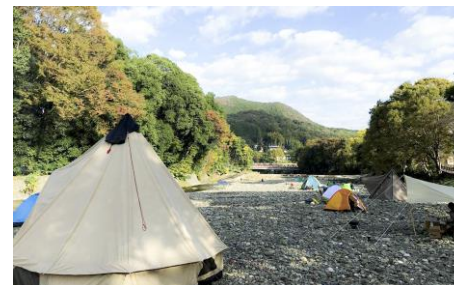
CAWAZ baseの真横 高麗川沿いの河原でキャンプ