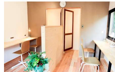
アネックス棟「コワーキング専用スペース（個室あり）」