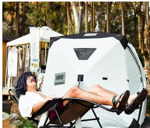
テントサウナ（イメージ）