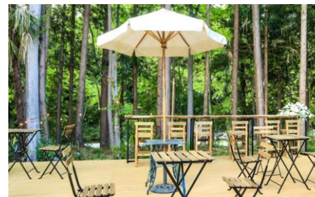
高麗川の清流を見渡せる「ウッドデッキ」