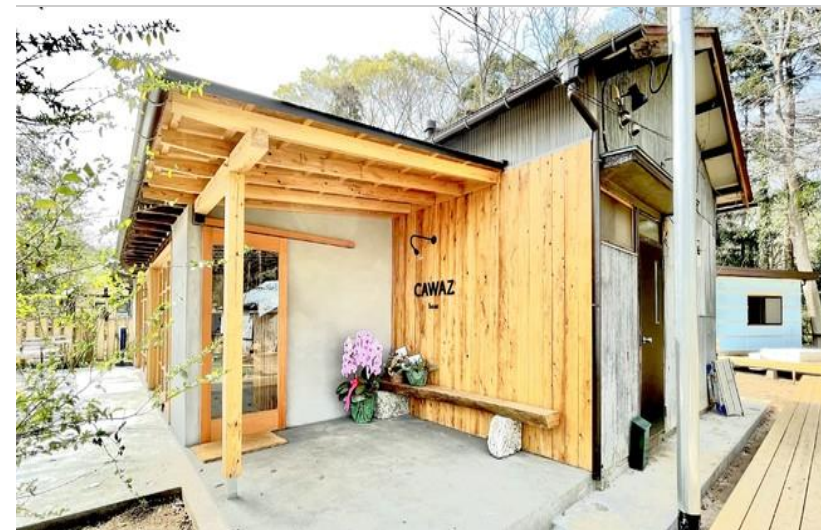
CAWAZ base カフェ＆コワーキング棟

都心から約1時間弱、奥武蔵の大自然に囲まれた埼玉県日高市に、築約60年の古民家を地元産のヒノキ「西川材」を使ってリノベーションした施設「CAWAZ base」があります。アネックス棟にはオンライン対応ブースもあり、集中して仕事ができる環境も備わっています。施設全体を貸し切り、社内研修やチームビルディングを行うことも可能です。また、仕事の後は施設内で地元の食材を使ったバーベキューや焚火をお楽しみ頂けます。また、河原にテントサウナを設置し、体を温めた後は高麗川に飛び出すこともできます！当施設でより生産的でストレスフリーな贅沢な環境で仕事と遊びを両立してみませんか？