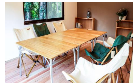
アネックス棟「ミーティングルーム」※定員8名