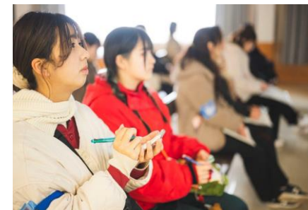
レクチャー(イメージ)