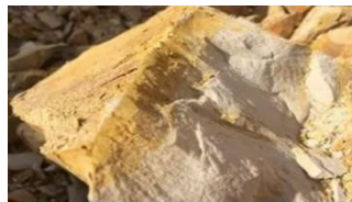
珪藻土(頁岩)子(イメージ)

珪藻土（けいそうど） とは、植物性プランクトン（珪藻）が、長年にわたり海底や湖底に堆積して化石化した天然の鉱物です。およそ800万年の時を経て地上に現れた、自然の恵みです。珪藻土は昔から火に強い土として、七輪、コンロ、耐火断熱レンガなどの原料に使用されてきました。そして現在では、浄水場やビール工場でのろ過材としても使用されています。ナノメーター（1mmの100万分の1）単位の孔が無数に並ぶ「超多孔質構造」を有するこの土は、調湿性という最大の特性と共に、「吸放湿機能」「脱臭性」「耐火性」など様々な優れた効果を発揮します。半永久的に利用できますが、再利用時には土に還すことができ、リフォームや解体時の廃棄物とならないゼロ・ウェイストを特徴とするエコマテリアルです。