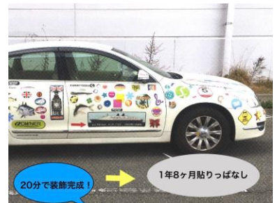
■ 車両へのラッピング利用例