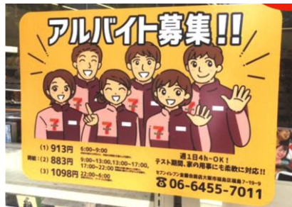
■ コンビニエンスストアのガラス面での利用例