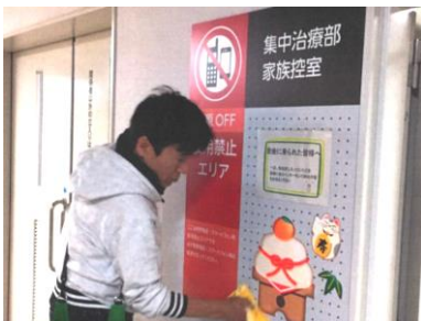
■ 病院の集中治療室での利用例

奈良県立医科大学 ICU(集中治療室)の室内装飾として採用、厳しい衛生基準が求められる病院内でも簡単に貼って剥がせる点が製品の強み