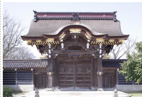
唐門<国指定重要文化財>