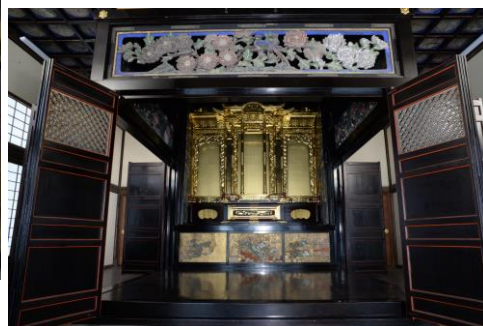
②御内仏 内陣 ※御内仏は国指定重要文化財