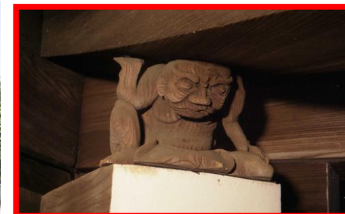
【七不思議】屋根を支える猿