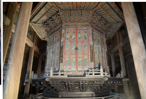
③八角輪蔵 (一周させれば取められた全てのお経を読んだことになる) ※八角輪蔵の取められた経堂は国指定重要文化財