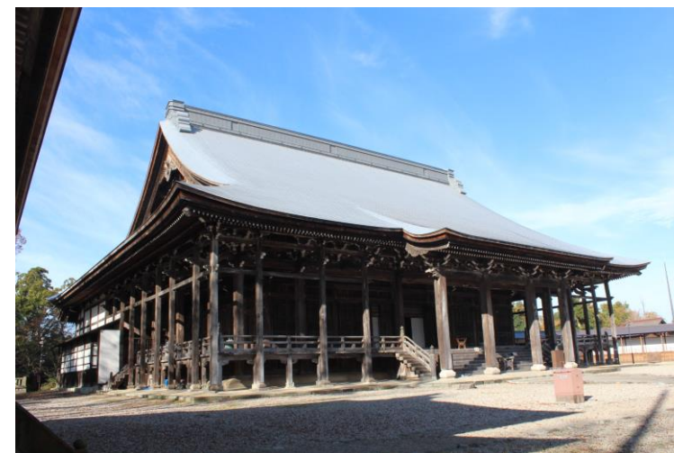
勝興寺 本堂<国指定重要文化財>